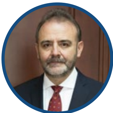
CRISTIAN ESPINOSA C

Viceministro de Relaciones Exteriores del Ecuador